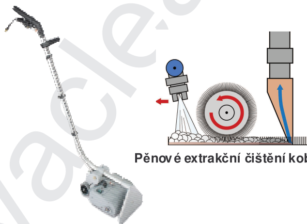
Pěnové extrakční čištění koberců